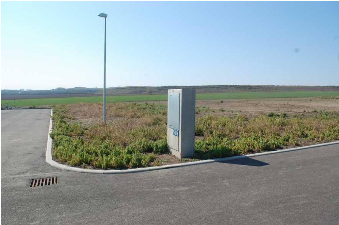
příjezdová komunikace - okolí